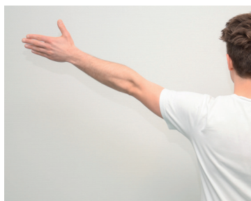
Test for smertebue.

metastaser. Man bør supplere med ultralyd- eller MR-skanning, hvis der ved den kliniske undersøgelse er mistanke om, at der er rotator cuff -ruptur [12]. Ultralyd- og MR-skanning er ligeværdige i diagnosticeringen af partiel og total rotator cuff -ruptur, mens man ved en ultralydskanning undertiden kan påvise en dynamisk afklemning af supraspinatussen.